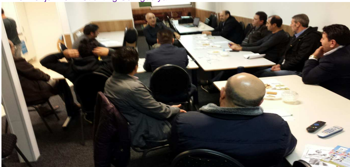
25 juli 2014 Ahi Evran Moskee