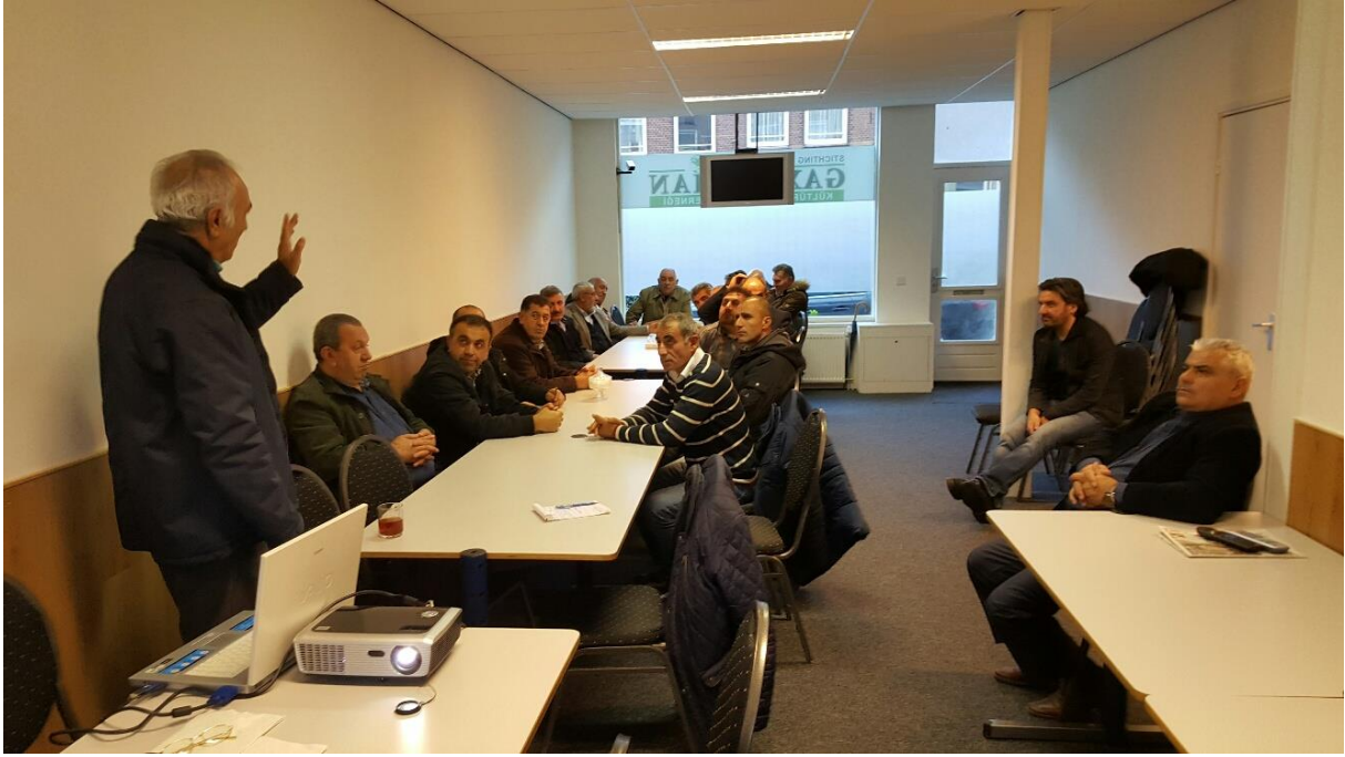
In Gaxmudian stichting 25-11-2015